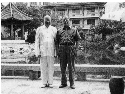
慈恩寺の隣りで、太極拳の先生と。

かつて名物管長と呼ばれた高田好胤管長様が《仏教伝来》を見た時に、これこそ仏教伝来の道であり、そしてこの作品を《仏教伝来》と銘打ったことに大変意義がある、とおっしゃって祈られたことを、今更のように感じている今日この頃であります。