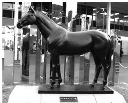
何年前かに大井競馬場にて撮影したものです。