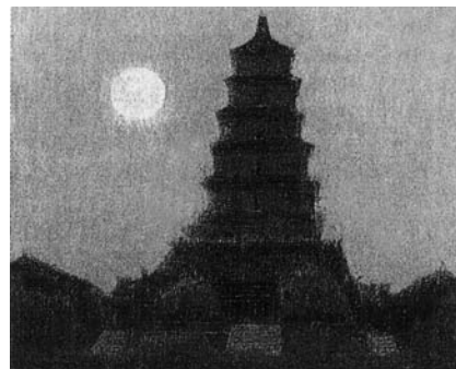
明けゆく長安大雁塔 慈恩寺に近接し玄奘の翻訳した經典を収めた。